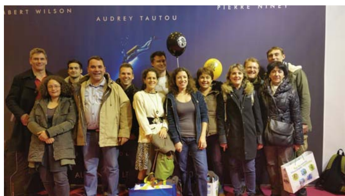
Salon de la Plongée