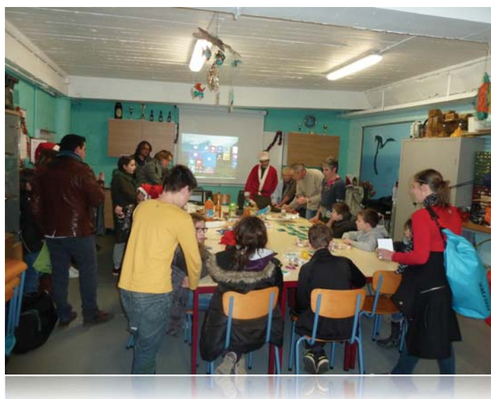
Le Noël 2015 des enfants