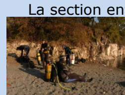
La section enfants